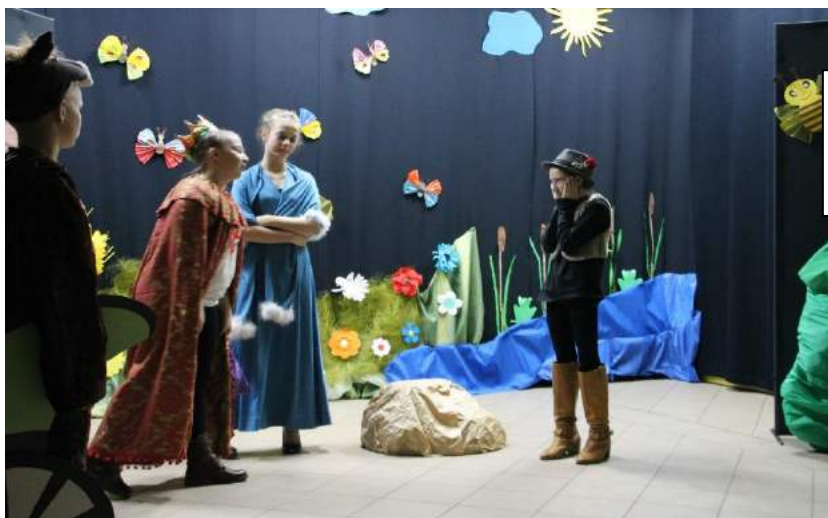
Fot. Uczniowie z Zespołu Szkół im. Jana Pawła II w Wilczej Woli w bajce „Kot w butach”