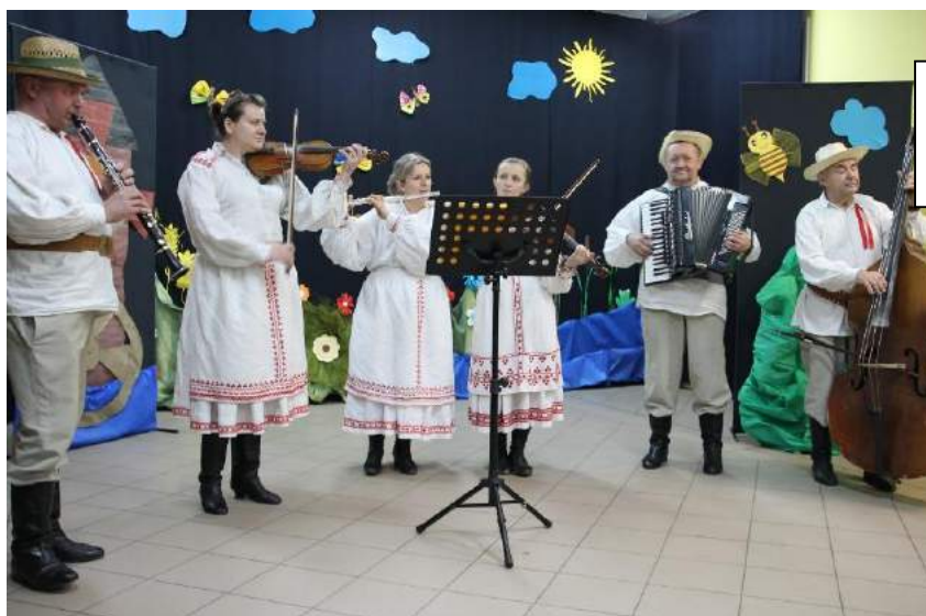
Fot. Kapela Dzikowanie podczas występu z okazji Dnia Seniora w Wilczej Woli