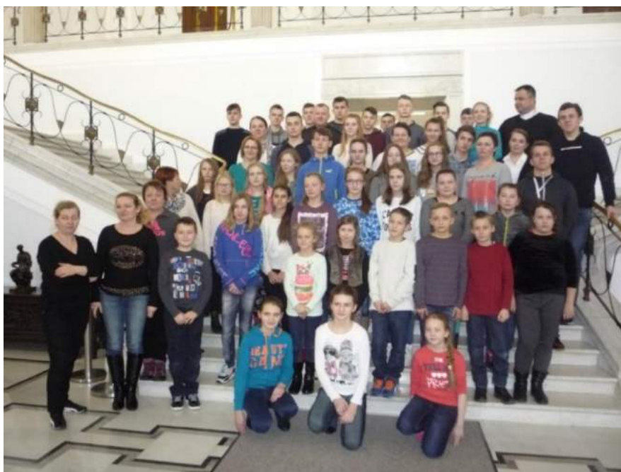
Fot. Młodzież szkolna ze Szkoły Podstawowej w Lipnicy podczas zwiedzania Sejmu.