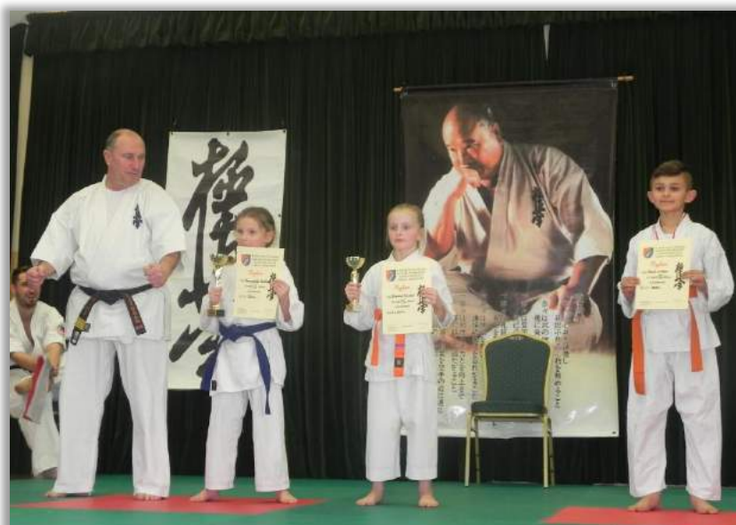
Fot. Podczas II Turnieju Karate o Puchar Wójta Gminy Dzikowiec

Fundatorzy nagród: Wójt Gminy Dzikowiec, SCK Dzikowiec, Klub Kyokushin z Nowej Dęby, Rodzice zawodników.