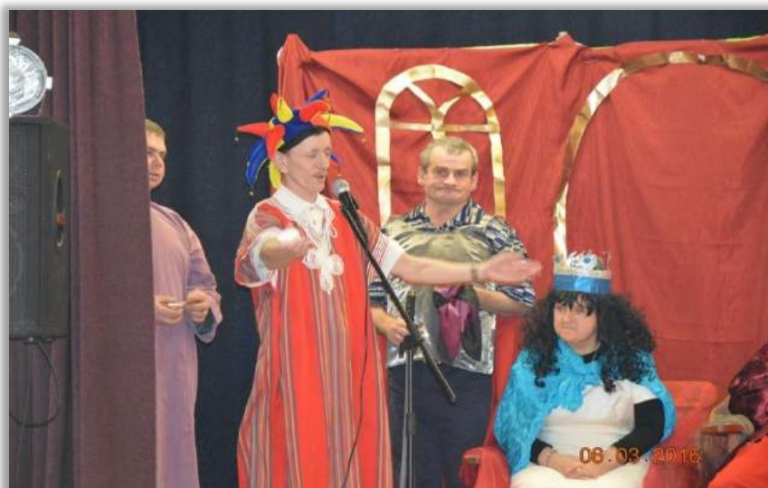
Fot. Uczestnicy SDŚ w Spiach podczas występu „Którędy do nieba...?”