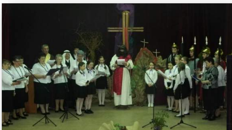
Fot. Podczas występu „Jezus Chrystus Królem Wszechświata”

„To nie gwoździe Cię przybiły, lecz mój grzech, To nie ludzie Cię skrzywdzili, lecz mój grzech, To nie gwoździe Cię trzymały, lecz mój grzech, Choć tak dawno to się stało, widziałeś mnie”