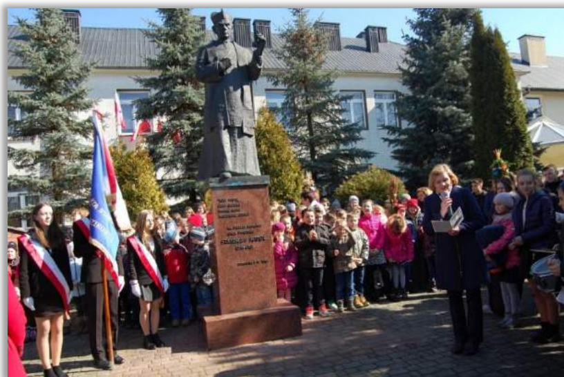
Fot. Uroczystości pod pomnikiem z okazji Dnia Patrona Szkoły